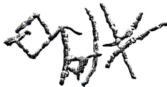
2. rajz, részlet Friedrich, 2010

Saját megfejtésem Ráduly rajza alapján BENEDEK DIÁK, azonban ezt a személyes megtekintés után módosítanom kell.