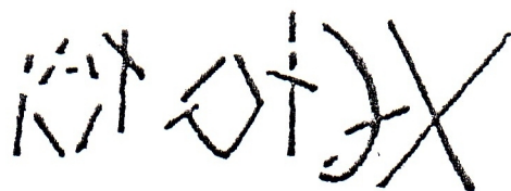
1. rajz : Ráduly, 1993

Ottjártunkkor, 2010-ben celofánra átrajzolva a jeleket, ettől néhány eltérést találtam a jobb oldali jelcsoportnál, a többi vonal pedig már nem volt pontosan követhető.